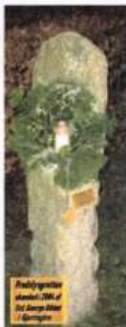
Fredsløset etableret 2001 af Det Århuske Biskop / Bjerringbro

FREDSLYSGROTTEN PÅ NIELS DUE JENSENS PLADS I BYCENTRUM